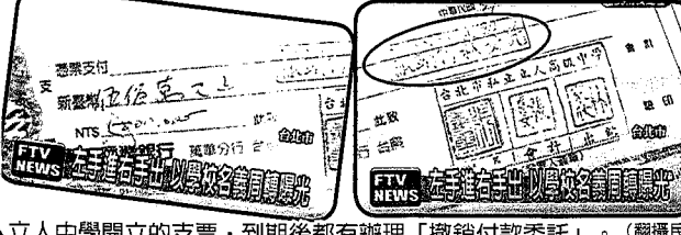
立人中學開立的支票，到期後都有辦理「撤銷付款委託」。